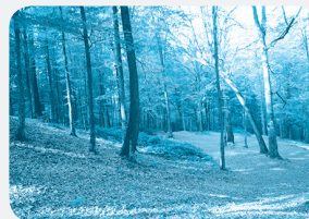
جنگل گلستان - استان گلستان