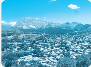
شهر کوهپایه‌ای سی‌سفت - کهگیلویه و بویراحمد

مثال: جغرافی‌دان با هدف توسعه یک شهر به مطالعه همه‌جانبه می‌پردازد و مسائل زیر را مطرح و مطالعه می‌کند: