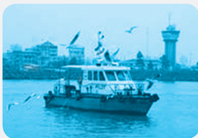
سامل بندر انزلی - گیلان

* عملکرد مثبت و منفی انسان را در هر یک از نواحی زیر بررسی و جدول را کامل کنید.