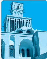
بادگیر دو طبقه ابرکوه - استان یزد