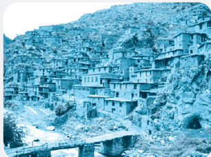
روستای پالنگان - کامیاران - کردستان