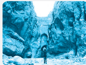
سد شاه عباسی (طیس، فراسان جنوبی) قدیمی‌ترین و بزرگ‌ترین سد قوسی جهان است که یکی از نمونه‌های عالی فلاقیته، دوران پیش و سفت‌کوشی ایرانیان است.

نکته محیط جغرافیایی از تعامل بین محیط طبیعی و محیط انسانی به وجود می‌آید.