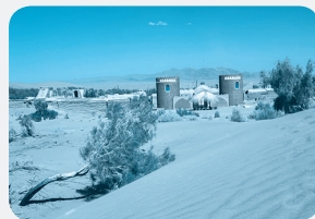
کویر مصر - اصفهان